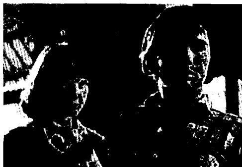
Les doigts dans la tête